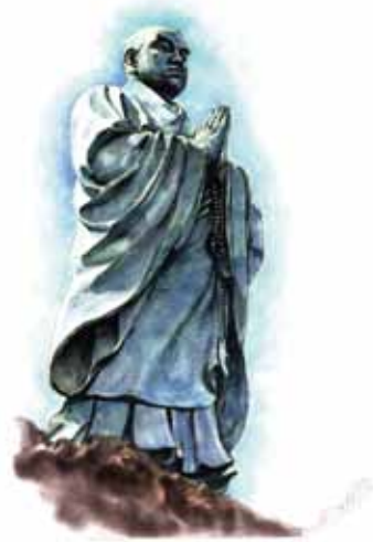
日頃感谢您し 銅像前にて唱題行